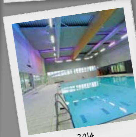
2014 IP65 LED lijnverlichting leverbaar