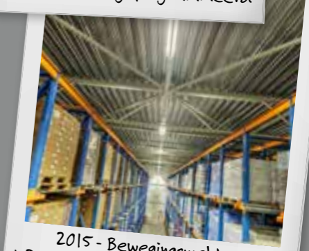
2015 - Bewegingsmelders MD-0 / MD-L met daglichtregeling en geluidsdetectie