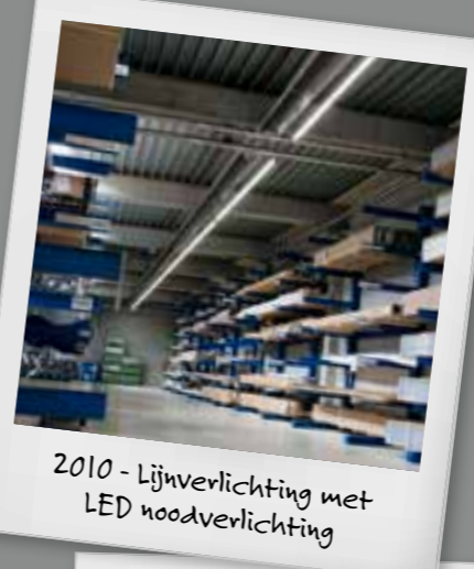
2010 - Lijnverlichting met LED noodverlichting