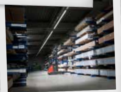
2009 Dynamische lijnverlichting