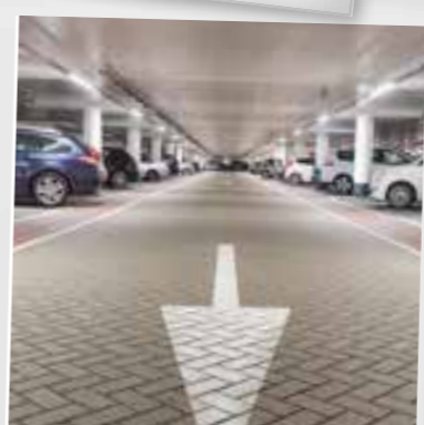
2013 Decentrale LED noodverlichting geïntegreerd in armatuur