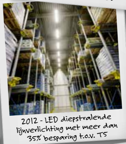
2012 - LED diepstralende lijnverlichting met meer dan 35% besparing t.o.v. T5