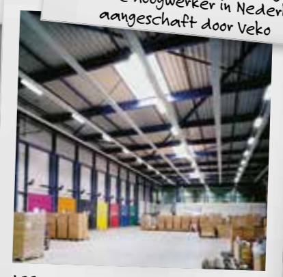
1995 - Lijnverlichting standaard voorzien van 7x2,5mm 2 vlakkabel